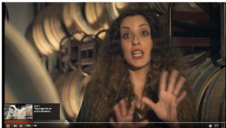
LIFE NATURA 2000 Value Crete, τηλεοπτικό σποτ «NATURA 2000 Έσοδα για το μέλλον»