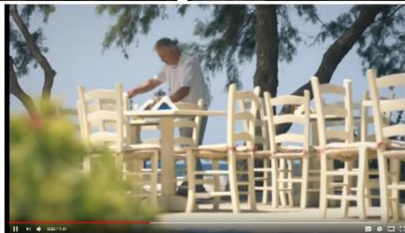
LIFE NATURA 2000 Value Crete, τηλεοπτικό σποτ «NATURA 2000 Έσοδα για το μέλλον»