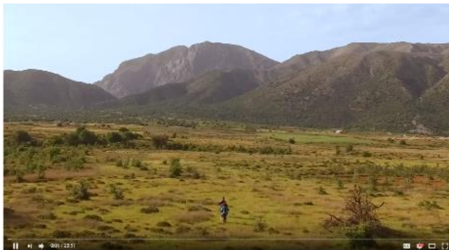
Ντοκιμαντέρ του έργου "LIFE Natura2000Value Crete"