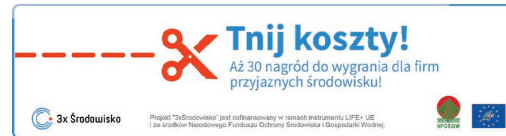
Przykładowa grafika promująca konkurs dla firm „Oszczędzaj, chroniąc środowisko” Example of a picture promoting the company competition „Save by saving the environment”.