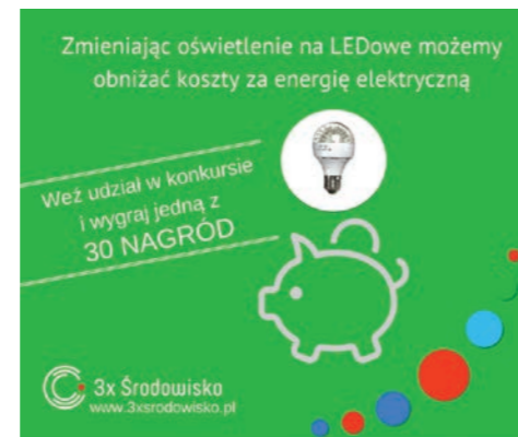
Przykładowe grafiki zachęcające do oszczędzania zasobów – fanpage „Ekologia w firmie” na Facebooku. Examples of pictures encouraging to save the resources - fanpage „Ekologia w firmie” on Facebook.