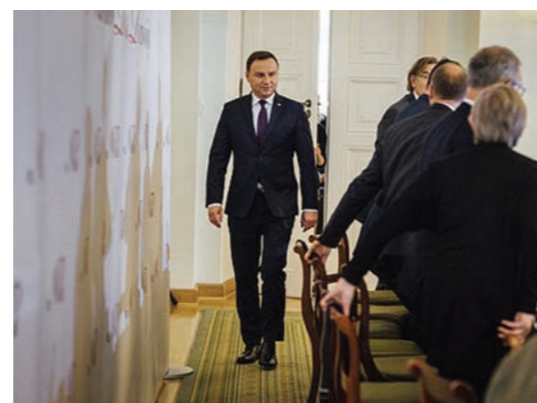
Spotkanie Narodowej Rady Rozwoju, podczas której prezentowano projekt w obecności Prezydenta RP. National Development Council meeting, where the project was presented to the President of Poland.