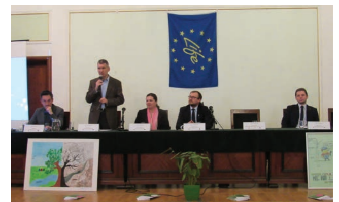
Konferencja prasowa podsumowująca projekt. Press conference summarizing the project.